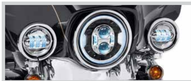
Teilenr. 67700426 – CHROM