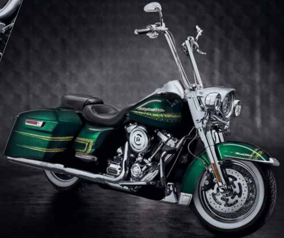
Road King®, individualisiert mit H-D® Genuine Motor Parts & Accessories*

Harley-Davidson bietet eine breite Palette an Zubehör-Beleuchtungsprodukten an, um Ihr Motorrad mit einer persönlichen Note und hervorragender Beleuchtungsleistung zu versehen.