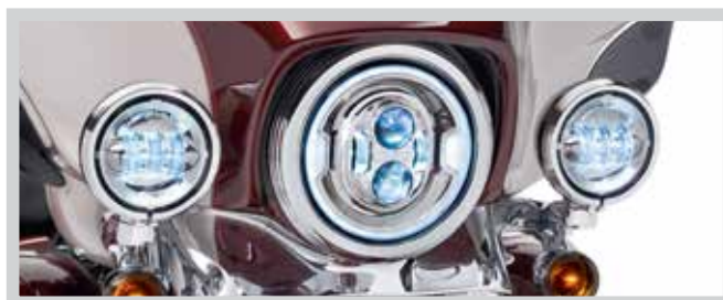
Teilenr. 67700433 – CHROM