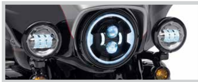
Teilenr. 67700430 – SCHWARZ