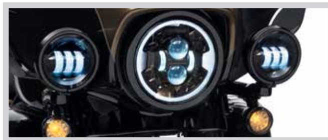
Teilenr. 67700427 – SCHWARZ